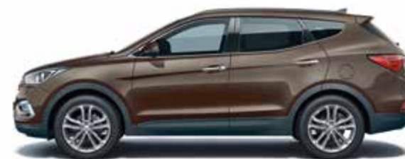
Tan Brown (перламутровый цвет)