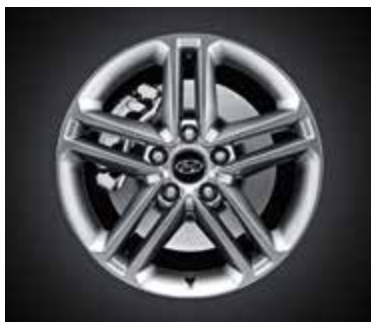
Comfort - 17", Light Grey