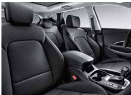
Черный. Comfort и Style – ткань, Premium – кожа