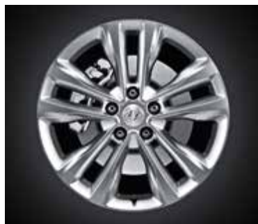
Style - 18", Hyper Silver