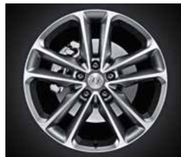
Premium - 19", Light Grey