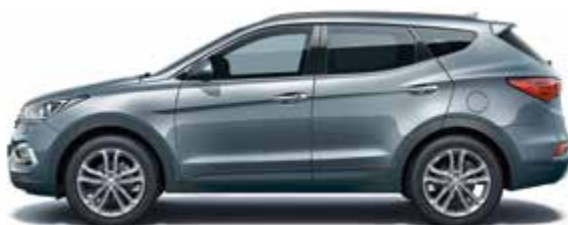
Titanium Silver (металлик цвет)