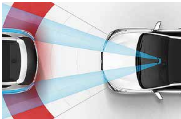
Система автономного экстренного торможения (АЕВ).

Внешний вид нового Santa Fe определенно внушает доверие. И всё это благодаря интеллектуальным технологиям активной безопасности, обеспечивающим всеобъемлющую защиту как для водителя и пассажиров, так и для пешеходов. Это существенная часть философии Hyundai - облегчить проблемы повседневной езды, и новый Santa Fe делает это превосходно. Оптимизированные дизельные и бензиновые двигатели стандарта Euro6 доступны с шестискоростной механической или автоматической трансмиссией.