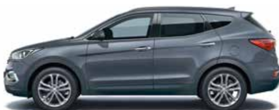
Ocean View (металлик цвет)