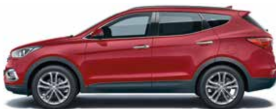
Red Merlot (перламутровый цвет)