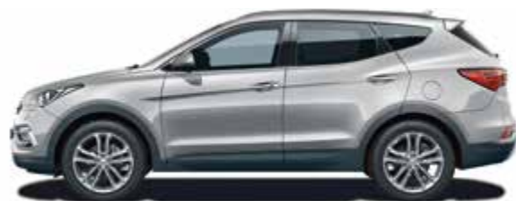
Platinum Silver (металлик цвет)