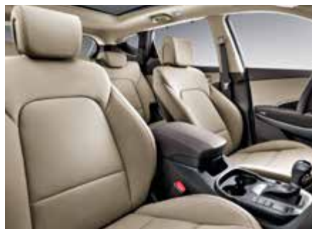
Бежевый. Comfort и Style – ткань, Premium – кожа