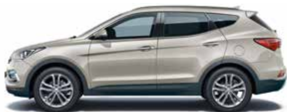
Chalk Beige (металлик цвет)