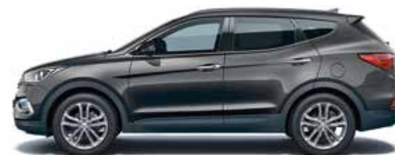
Phantom Black (перламутровый цвет)