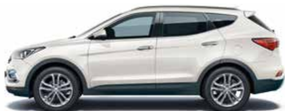
Pure White (основной цвет)

Чтобы узнать больше о новом Santa Fe, посетите www.hyundai.ee/lv/lt